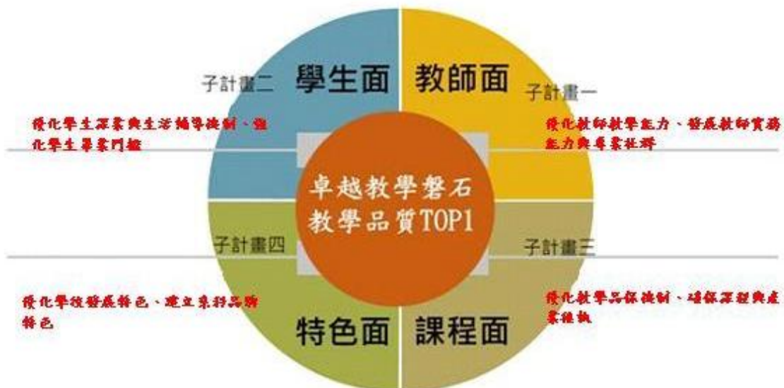
圖 1-1 教學深化-「輔航攜手、邁向康寧 TOP1」架構圖

故，本次教學深化-「輔航攜手、邁向康寧 TOP1」計畫架構圖，如圖 1-1 所示。